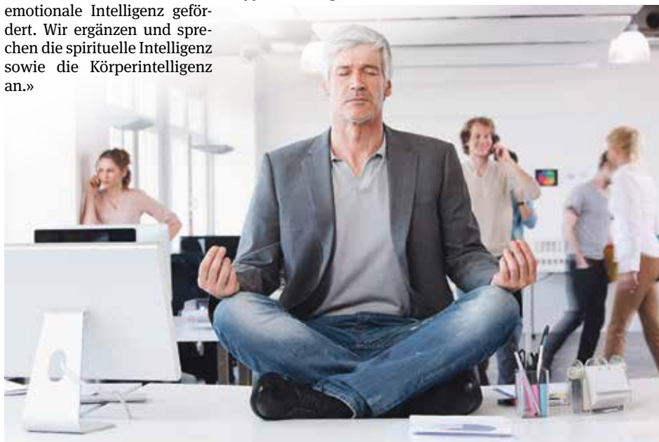
Die innere Gelassenheit hilft, auch in hektischen Momenten den Kopf nicht zu verlieren.