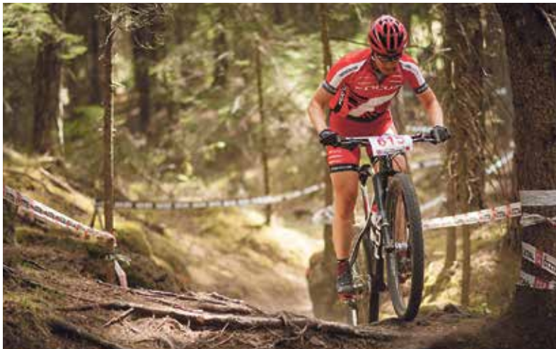
Eine junge Urnerin sorgt sportlich wie beruflich für Aufsehen. ANDREAS DOBSLAFF